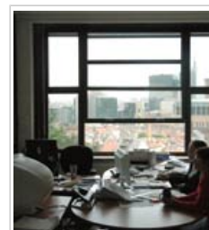
Es necesario determinar cómo están expuestas las personas a los contaminantes del aire interior

9.1 Los datos disponibles para evaluar los riesgos de la contaminación del aire interior son escasos y, a menudo, insuficientes. Existe información sobre el nivel de concentración en el aire interior de algunos contaminantes muy conocidos, pero no sobre otros contaminantes cuyos efectos no están claros. Las medidas de la calidad del aire exterior no pueden extrapolarse para predecir las concentraciones en los edificios.