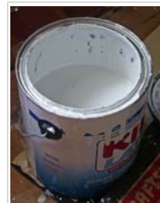
Ciertas pinturas emiten sustancias químicas

Algunos estudios muestran una relación entre el uso de ciertos productos de consumo y efectos adversos para la salud. Sin embargo, no está claro hasta qué punto los contaminantes son responsables de los efectos observados, ya que hay otros factores que pueden contribuir a ellos.