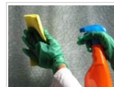
Varios productos de limpieza emiten sustancias químicas

Algunos contaminantes del aire interior proceden del exterior, pero la mayoría se liberan dentro del propio edificio, por ejemplo al limpiar o al quemar combustible para cocinar o producir calor. El mobiliario y los materiales de construcción también pueden emitir contaminantes. La humedad y la falta de ventilación pueden aumentar aún más la contaminación del aire interior.