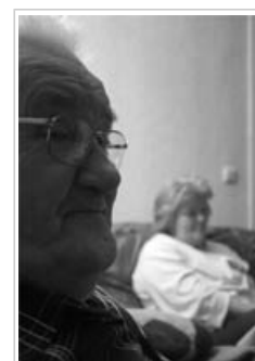
Algunas personas son más vulnerables que otras a la contaminación del aire interior

Aparte de la edad y la presencia de enfermedades cardiovasculares o respiratorias, otros factores que podrían hacer que algunas personas sean más vulnerables son la predisposición genética, el estilo de vida, la alimentación y otros problemas de salud.