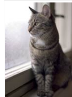
Los animales domésticos y los dañinos son fuentes de alérgenos

Uno de los principales causantes de mala calidad del aire interior es una ventilación insuficiente, que puede afectar a la salud y al rendimiento en el trabajo.