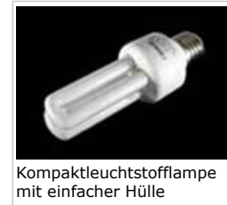
Kompaktleuchtstofflampe mit einfacher Hülle

Künstliches Licht setzt sich aus sichtbarem Licht und etwas ultravioletter (UV) sowie infraroter (IR) Strahlung zusammen und es besteht Besorgnis, dass die Emissionswerte einiger Lampen schädlich für Haut und Augen sein könnten. Sowohl natürliches als auch künstliches Licht kann die biologische Uhr des Menschen und sein Hormonsystem stören, was zu Gesundheitsproblemen führen kann. Die ultravioletten und die blauen Anteile des Lichts besitzen das größte Schadenspotenzial.