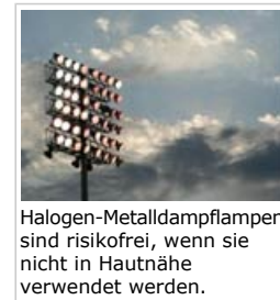
Halogen-Metaldampflampen sind risikofrei, wenn sie nicht in Hautnähe verwendet werden.

Menschen erzeugen seit langem künstliches Licht durch Verbrennen oder Erhitzen von Stoffen erzeugt und heutzutage sind Kerzen und andere flammenbetriebene Lampen noch allgemein im Gebrauch. Die Entdeckung der Elektrizität brachte Glühlampen, in denen typischerweise ein Metalldraht in einem abgedichteten Glasrohr durch elektrischen Stromfluss zum Glühen gebracht wird. Dies sind die herkömmlichen Glühbirnen, die über viele Jahre verwendet wurden aber nun zugunsten energiesparender Lampen abgeschafft werden. Halogenlampen funktionieren nach dem gleichen Prinzip, aber sie enthalten in der Röhre noch ein Gas, wodurch das Licht viel heller und die Lampe effizienter wird.