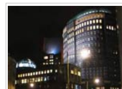
Nachts Licht ausgesetzt zu sein, kann den Schlaf-Wach-Rhythmus stören

Der UV-Strahlung zu sehr ausgesetzt zu sein, kann kurzfristig zu Verbrennungen führen und trägt langfristig zum Hautkrebsrisiko bei (Melanom sowie Plattenepithelkarzinomen und Basalzellgeschwülsten). Laut einem negativem Extrem-Szenario könnten die höchsten gemessenen UV-Werte von in Büros und Schulen verwendeten Lampen zur Zahl der Plattenepithelkarzinome in der EU-Bevölkerung beitragen - dies wäre jedoch nicht für die im Haushalt benutzten, weniger Strahlung abgebenden Lampen der Fall-.