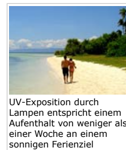
UV-Exposition durch Lampen entspricht einem Aufenthalt von weniger als einer Woche an einem sonnigen Ferienziel

Kurzzeitige UV-Wirkungen von künstlicher Beleuchtung auf gesunde Menschen werden für vernachlässigbar gehalten. Es ist nicht möglich, Langzeitriskiken zu beurteilen, weil es keine Expositionsdaten gibt, aber es können Schätzungen gemacht werden, bei denen man vom ungünstigsten Fall ausgeht. Dabei wird davon ausgegangen, dass jemand bei der Arbeit und in der Schule Kompaktleuchtstofflampen mit der höchsten UV-Strahlung ausgesetzt ist, obwohl in der Praxis die Exposition gegenüber Leuchtstofflampen niedriger ist.