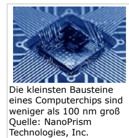
Die kleinsten Bausteine eines Computerchips sind weniger als 100 nm groß

Konsumgüter wie Kosmetikprodukte, Sonnenschutzmittel, Fasern, Textilien, Farbstoffe und Anstrichfarben enthalten bereits Nanopartikel.