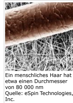
Ein menschliches Haar hat etwa einen Durchmesser von 80 000 nm

Nanotechnologie hat das Potenzial, erheblichen Einfluss auf die Gesellschaft auszuüben. In der Informations- und Kommunikationsbranche beispielsweise wird diese Technologie bereits genutzt. Desweiteren kommt sie in Kosmetikprodukten und Sonnenschutzmitteln, in Textilien, Beschichtungen, in einigen Lebensmittel- und Energietechnologien sowie in Medizinprodukten und Medikamenten zur Anwendung. Darüber hinaus könnte die Nanotechnologie dazu beitragen, die Umweltverschmutzung zu reduzieren.