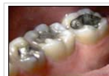
Siehe auch unsere Zusammenfassung über Zahnamalgam [siehe http://publications.greenfacts.org/de/zahnamalgam/index.htm ]

3.2 Jedes Jahr sind Naturereignisse (z.B. Vulkanaktivität, Verwitterung von Gesteinen) und menschliche Aktivitäten (z.B. Bergbau, Kraftstoffbenutzung, Zahnamalgame) verantwortlich für das Freisetzen von Tausenden von Tonnen Quecksilber in die Umwelt.