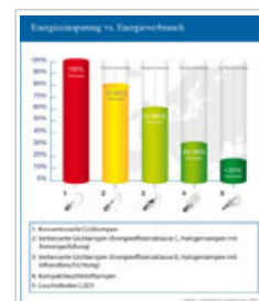
Vergleich des Energiesparpotenzials verschiedener Lampentypen [siehe Anhang 1, S. 5]

3.1 Im Vergleich zu herkömmlichen Glühlampen sparen Kompaktleuchtstofflampen nicht nur Energie, sondern sie verursachen während ihrer gesamten Lebensdauer auch weniger Quecksilberemissionen. Diese Emissionseinsparung übertrifft die in ihnen enthaltene Quecksilbermenge, die bei einem Bruch oder bei unsachgemäßer Entsorgung freigesetzt werden könnte.