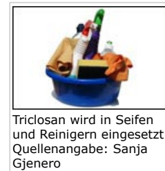
Triclosan wird in Seifen und Reinigern eingesetzt

2.1 In Kosmetika dient Triclosan als Konservierungsstoff. Verwendet wird es auch Seifen, Deodorants sowie in Zahnpasten, wo es der gegen Zahnbelagbildung entgegen wirkt und für gesünderes Zahnfleisch sorgt.