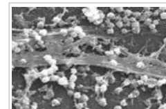
Bakterien, die als Biofilm wachsen, sind in der Lage feindliche Bedingungen zu überleben.

5.1 Einige Bakterien werden natürlicherweise nicht von Triclosan angegriffen. Andere haben Abwehrmechanismen dagegen entwickelt, während sie unter Laborbedingungen niedrigen Konzentrationen ausgesetzt wurden. Wenn bei solchen Mechanismen Genveränderungen eine Rolle spielen, könnten diese Eigenschaften den folgenden Generationen vererbt oder sogar zwischen verschiedenen Bakterien übertragen werden.