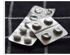
Los envases blíster pueden impedir que los niños ingieran botes enteros de medicamentos.

Las medidas de seguridad introducidas en los últimos 30 años, como los envases a prueba de niños y el cambio a sustancias menos nocivas, han reducido el número de envenenamientos por productos para el hogar. Hoy en día los casos graves de envenenamiento son muy poco comunes. Asimismo, se han puesto en marcha campañas de educación dirigidas a los padres y normativas sobre el almacenamiento en envases de alimentos, pero ninguna de estas medidas ha supuesto una solución definitiva.