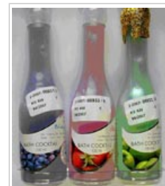
Productos de consumo en envases que se asemejan a alimentos. [véase el anexo 1, pág. 7]

La mayoría de los envenenamientos se producen en el hogar y los productos involucrados son, además de medicamentos, principalmente cosméticos y productos de cuidado personal , tales como geles de ducha, champús, lociones corporales, jabones y esmaltes de uñas; productos de limpieza como lejía, limpiadores de baño y detergentes. Generalmente, las personas que ingieren accidentalmente productos para el hogar no sufren ningún daño y no presentan síntomas. Entre los pacientes que acuden a una clínica u hospital, la mayoría no necesita tratamiento, aunque en algunos casos se realiza un lavado de estómago o se administran medicamentos para controlar los síntomas. Los accidentes de este tipo muy raramente son mortales.