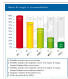
Comparación del potencial de ahorro de energía de distintos tipos de bombillas [véase el anexo 1, pág. 5]

Sin embargo, las instalaciones en las que se recogen y reciclan lámparas podrían plantear un problema medioambiental local si no se ocupan adecuadamente de las potenciales emisiones de mercurio.