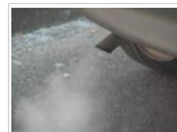
En las zonas urbanas, las nanopartículas provienen en su mayor parte de motores diésel o automóviles con catalizadores estropeados o funcionando en frío

4.3 Tanto en las zonas rurales como en las urbanas, un litro de aire puede contener millones de nanopartículas. En las zonas urbanas, las nanopartículas provienen en su mayor parte de motores diésel o automóviles con catalizadores estropeados o funcionando en frío. En algunos lugares de trabajo, la exposición a las nanopartículas presentes en el aire puede plantear un riesgo potencial para la salud.