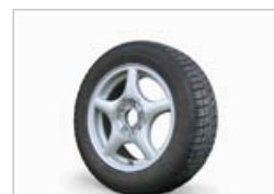
Las nanopartículas pueden mejorar la adherencia de los neumáticos

Las nanopartículas pueden servir para aumentar la seguridad de los automóviles , por ejemplo mejorando la adherencia de los