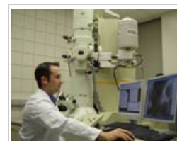
Un científico trabajando con un microscopio electrónico

7.2 La mayoría de las personas se exponen cotidianamente a las nanopartículas presentes en el aire ambiente, que proceden en gran parte del humo de los motores diésel. Se trata de una