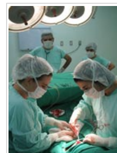
Des biocides sont utilisés dans les hôpitaux pour prévenir et contrôler les infections.

6.4 Les biocides sont utilisés dans des quantités telles qu'on peut en retrouver en petites concentrations partout dans l'environnement. La possibilité que l'exposition continue de bactéries aux biocides puisse mener à l'émergence de souches résistantes est source de préoccupations, mais cela n'a pas encore été démontré clairement en pratique.