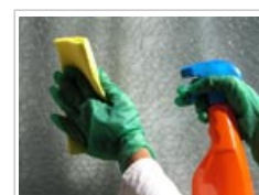
On ajoute par exemple les biocides dans les produits de nettoyage.

2.3 Dans l' industrie alimentaire , on utilise communément des biocides pour désinfecter les installations et tout appareil qui entre en contact avec des denrées alimentaires, ainsi que pour