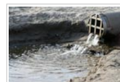
Des biocides sont rejetés avec les eaux usées.

3.5 Les biocides étant utilisés en grandes quantités et rejetés avec les eaux usées, ils sont présents partout dans l'environnement à faibles concentrations. La crainte est que cela puisse conduire à la survie sélective de bactéries résistantes.