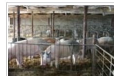
Des biocides sont utilisés dans l'élevage.

2.4 Dans l' élevage du bétail , les animaux eux-mêmes, leurs produits et tous les logements et les appareils utilisés sont généralement traités avec des biocides pour les décontaminer, empêcher la croissance de micro-organismes potentiellement nocifs et protéger les animaux contre les maladies.