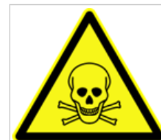
Certains symboles de danger peuvent rendre un produit encore plus attrayant pour les enfants.

De plus, les enfants ont tendance à préférer les goûts sucrés et les odeurs fruitées ou de bonbons, mais il est difficile de prédire exactement quelle sorte de parfum les attirera.