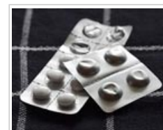
Les plaquettes peuvent empêcher les enfants d'avaler tout un flacon de médicaments.

Les mesures de sécurité instaurées ces 30 dernières années, telles que des emballages à l'épreuve des enfants et le passage à des produits moins nocifs, ont réduit le nombre d'empoisonnements par ingestion de produits ménagers. Aujourd'hui, les cas d'empoisonnement grave sont très rares. Des campagnes de sensibilisation destinées aux parents et des réglementations sur le stockage dans des contenants pour aliments ont également été mises en œuvre, mais rien de tout cela ne suffit totalement.