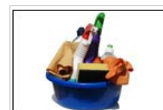
L'ingestion de produits ménagers est potentiellement plus nocive que l'ingestion de cosmétiques.